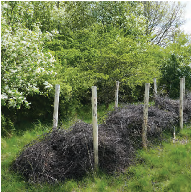
Kvashegn på golfbanen giver ly