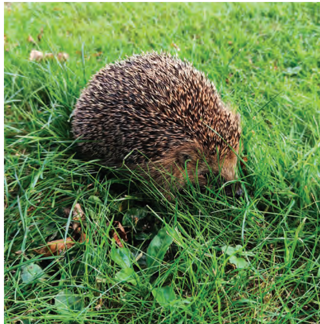
Pindsvin er afhængige af lugtesansen.

Pindsvin lever solitært uden territorier, og accepterer hinandens tilstedeværelse, især hvis der er mad nok. Og det er kun når pindsvinehunnen passer ungerne, at de lever sammen. Pindsvin er nataktive og typisk fremme fra skumringstid til solen står op. I parrings-tiden kan aktiviteten dog være længere.