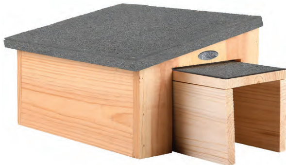
Pindsvinehus af grantræ med indgang

Pindsvinet går i hi omkring november, og sover indtil det bliver varmt igen. Den bygger en rede af blade, græs og mos. Vi vil prøve at sætte et pindsvinehus ude i roughen, så den har ro til at overvintre. Indgangen til huset skal helst vende mod syd eller sydvest for at give optimal sol og varme.